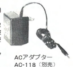
ACアダプター AC-118 (別売)