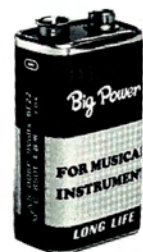
マクソン・ビックパワー 楽器専用電池