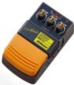
OD - F 1 オーバードライブ ¥5,500

マクソン「ファイヤーブレードシリーズ」エフェクターは、攻めのサウンドメイクギヤ！アグレッシブなスタイルと、確実な踏み込みを追求したワイドスイッチペダルを採用。低価格ながら、マルチエフェクターではだせないコンパクトエフェクターならではの音作りが可能です。品質もGoodなお値打ち品。