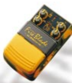
SM - F 1 スーパーメタル ¥7,800