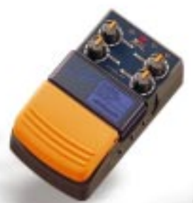
CS - F 1 コーラス ¥8,500