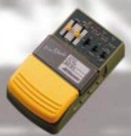
AF - F 1 オートフィルター ¥8,900