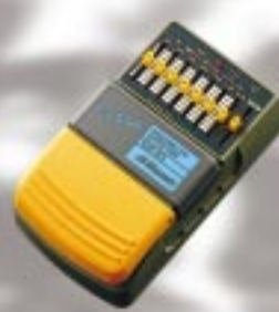
GE - F 1 グラフィックイコライザー ¥8,800