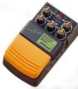
DS - F 1 ディストーション ¥6,600