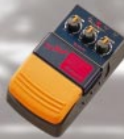
CP - F 1 コンプレッサー ¥6,000