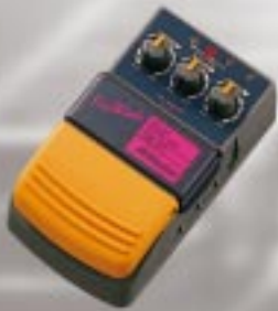
DE - F 1 ディレイ ¥8,800