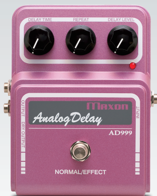
AD999 Analog Delay ¥31,500 (税込)

BBD ICを使用した本物のアナログ・ディレイ。アナログならではのリッチで暖かい、有機的なサウンドを兼ね備えています。驚異の900mSec.というロング・ディレイで、スロー・バラードでもテンポに合わせたセッティングが可能。さらに発振によるフィードバック効果で過激なサウンドを演出できます。ローノイズの4PDT機械式スイッチを採用。