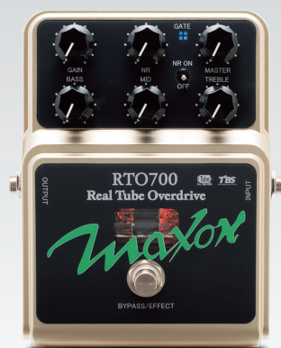
RTO700 Real Tube Overdrive ¥44,940 (税込)

クリッピング・ダイオードを使用しないRTO700は、真空管とハイゲイン・アンプを使うことによって、ピッキングやボリューム・コントロールに対する高い反応性を持っています。3バンドのEQを装備しており、多彩な音作りが可能で、クリーン・トーンを得意とするトランジスタ・アンプに、真空管アンプがもつウォームな音色をあたえます。ON/OFFの切り替えが可能なノイズ・リダクションを装備。