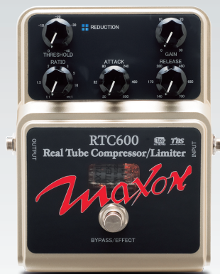
RTC600 Real Tube Compressor/Limiter ¥44,940 (税込)

真空管を搭載し、ウォームで生き生きとしたサウンドを生み出すコンプレッサー/リミッター。高性能なRMSレベル検出回路と低雑音VCAを採用しており、ローノイズかつ、ワイドなダイナミックレンジを実現しました。ギターだけではなくベースにも最適で、フレーズに太さと安定性を加えます。アタックとリリースコントロールも搭載し、スタジオ機器に匹敵する詳細な設定とサウンドを作り出すことができます。