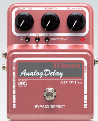
AD999Pro Analog Delay ¥40,950 (税込)

AD999ProはAD999からコンセプトをピックアップし、新しいノイズ・リダクション回路とマルチヘッド・シミュレーション機能を搭載してさらに進化しています。特に低音域のレスポンスを改良し、芯のあるサウンドが得られます。マルチヘッド・モードでは昔のテープ・エコーをシミュレートでき、趣のあるサウンドを再現します。