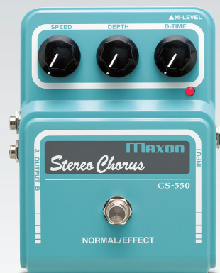
CS550 Stereo Chorus ¥24,150 (税込)

CS550はギター・サウンドに立体感と奥行きを与え、重厚かつ広がりのあるコーラス・サウンドをクリエイトします。原音をそこごうことなく、アナログらしい暖かいウネリと、クリーンで奥行きを感じさせる定番コーラス・サウンドから、きめ細かいトレモロ・サウンドまで柔軟に対応します。ギターだけではなく、ベースやキーボードなどに使用してもその効果を発揮します。