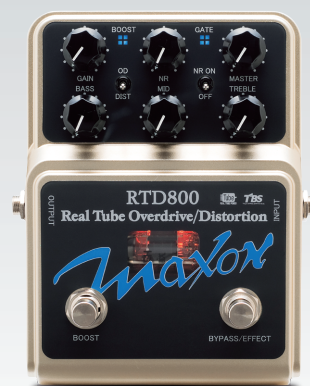
RTD800 Real Tube Overdrive/Distortion ¥49,980 (税込)

オーバードライブとディストーションを一台に収めたオール・イン・ワン・ペダル。トグルスイッチの切替えによりMaxonの伝統的なオーバードライブ・サウンドとメタリックなディストーション・サウンドを使い分けることができます。そのサウンドはただやみくもに歪ませてしまうだけのディストーションとは一線を画し、ピッキングのニュアンスを残しつつもパワフルで圧倒的な音圧感を加えます。